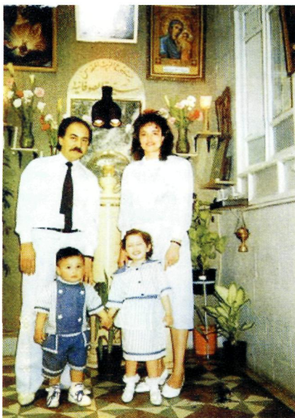
Мірна з чоловіком і дітьми