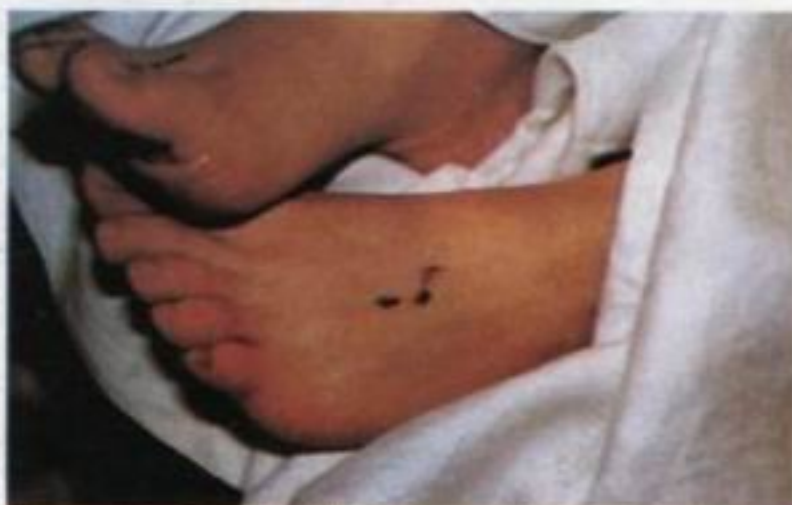
A lábak stigmája