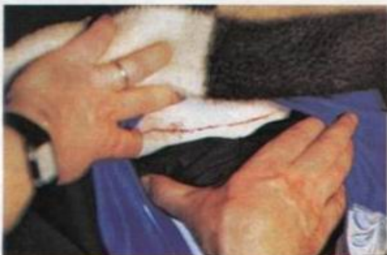
Az oldalsó stigma