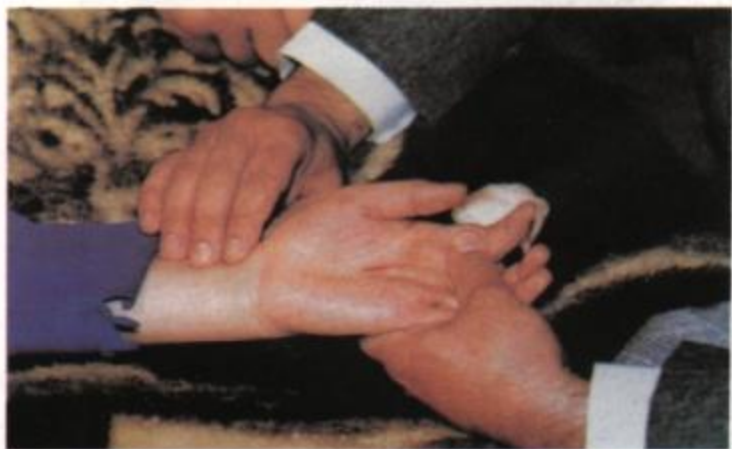
A bal kéz stigmája