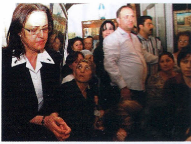
Début de l'exsudation pendant la Messe